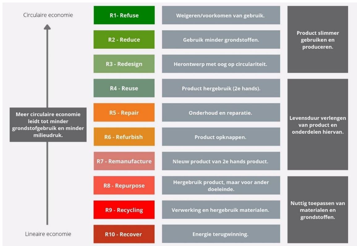
Figuur 3 Prioriteitsvolgorde circulariteit strategieën conform de 'R-ladder (strategieën van circulariteit)' (gebaseerd op Cramer, 2014; Hanemaaijer; 2018; Potting, 2016; Reike, 2018)

van producten. Het midden van de ladder (R3-Redesign, R4-Re-use, R5-Repair, R6-Refurbish, R7-Remanufacture, R8-Repurpose) is gericht op het verlengen van de levensduur van producten en onderdelen. Onderaan de ladder (R9-Recycling, R10-Recover) staat het nuttig verwerken van materialen die anders verbrand zouden worden. De R-ladder laat zien dat de hoogste prioriteit om duurzaam te werken 'R1-Refuse' is, oftewel, niet gebruiken. Kortom, hoe lager het grondstofgebruik, des te hoger op de R-ladder.